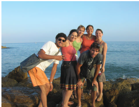
Etudiants près de la plage