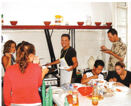
Cours de cuisine

L'institut organise un pot de bienvenue et/ou une fête d'adieu afin que professeurs et élèves puissent mieux se connaître dans une ambiance détendue et agréable.