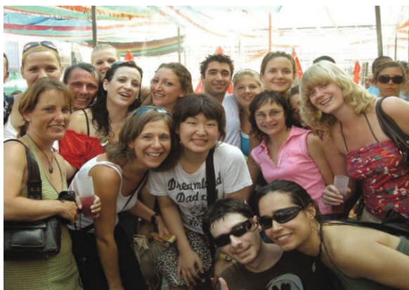
Excursion au village Alora