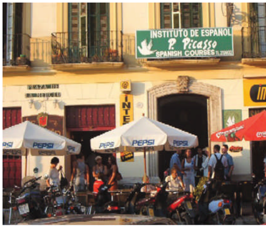
L'entrée de l'Institut

V ous voilà devant notre Institut. Sachez que c'est l'école la plus typique et représentant le plus la tradition de toute la ville de Málaga car, en effet, nous sommes situés au meilleur endroit, au cœur même du centre historique et culturel, à côté de la maison où naquit Pablo Ruiz Picasso.