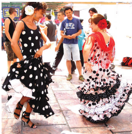
Feria - fête de Malaga