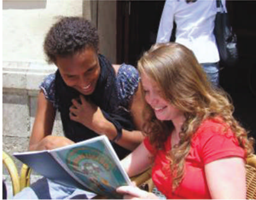
Les étudiantes devant l'école