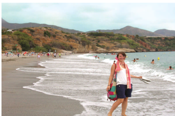
Plage de Nerja

Chaque week-end, nous proposons une excursion vers un lieu d'intérêt culturel et touristique, accompagnés par un professeur-guide..