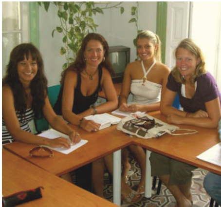
Les étudiantes dans la classe

NIVEAU 2 - INTERMEDIAIRE I (A2) / II (B1): Nous étudierons les temps du passé et leurs différences. Familiarisation avec le futur, le conditionnel, les formes d'obligation et l'impératif. Cours de conversation dirigée et exercices de vocabulaire.