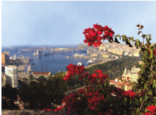
Vue panoramique sur Malaga

V ous franchissez le seuil de l'Institut où sont déjà passés des milliers d'étudiants du monde entier depuis 1982 dans le but d'apprendre l'espagnol à Malaga, la deuxième ville d'Espagne dans l'étude de l'espagnol.